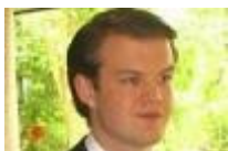
von Oliver Schirg

- CDU-Nachwuchspolitiker sieht sich als Opfer