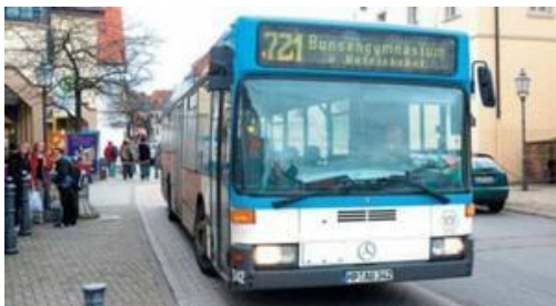
Tatort Sandhausen: In einem solchen Bus der Linie 721 in Richtung Heidelberg wurde der 29-jährige Walldorfer angegriffen.