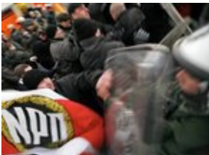
Die Polizei greift ein

Schon Stunden vor dem NPD-Aufmarsch hatte sich ein massives Polizeiaufgebot am Offenbacher Ostbahnhof postiert. Als die etwa 50 Rechtsextremen um 14 Uhr loszogen, wurden sie von mehreren hundert Beamten begleitet.